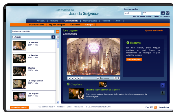
SITE INTERNET DE VOD/EOD.